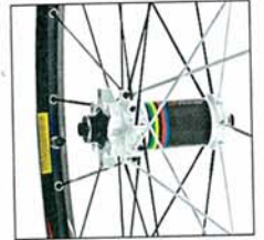
CONTROLÉ SL XC 999 EURO GEWICHTSBSCHRÄNKUNG Keine

BESCHREIBUNG Aluminium-Felge mit Messer-Speichen; Das Vorderrad ist mit 24 Speichen radial und 4-fach, Hinterrad 28 Speichen 4-fach gekreuzt gespeicht. Nabe aus Carbon und Alu. 6-Loch-Scheibenaufnahme, inkl. Schnellspanner und Tubeless-Ventilen.