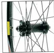
CONTROLÉ XC RACE 799 EURO GEWICHTSBSCHRÄNKUNG Keine

BESCHREIBUNG Aluminium-Felge mit konifizierten Speichen (2,0/1,5/2,0 mm); Das Vorderrad ist mit 24 Speichen radial und 3-fach, Hinterrad 28 Speichen 3-fach gekreuzt gespeicht. 6-Loch-Scheibenaufnahme, inkl. Schnellspanner und Tubeless-Ventilen.